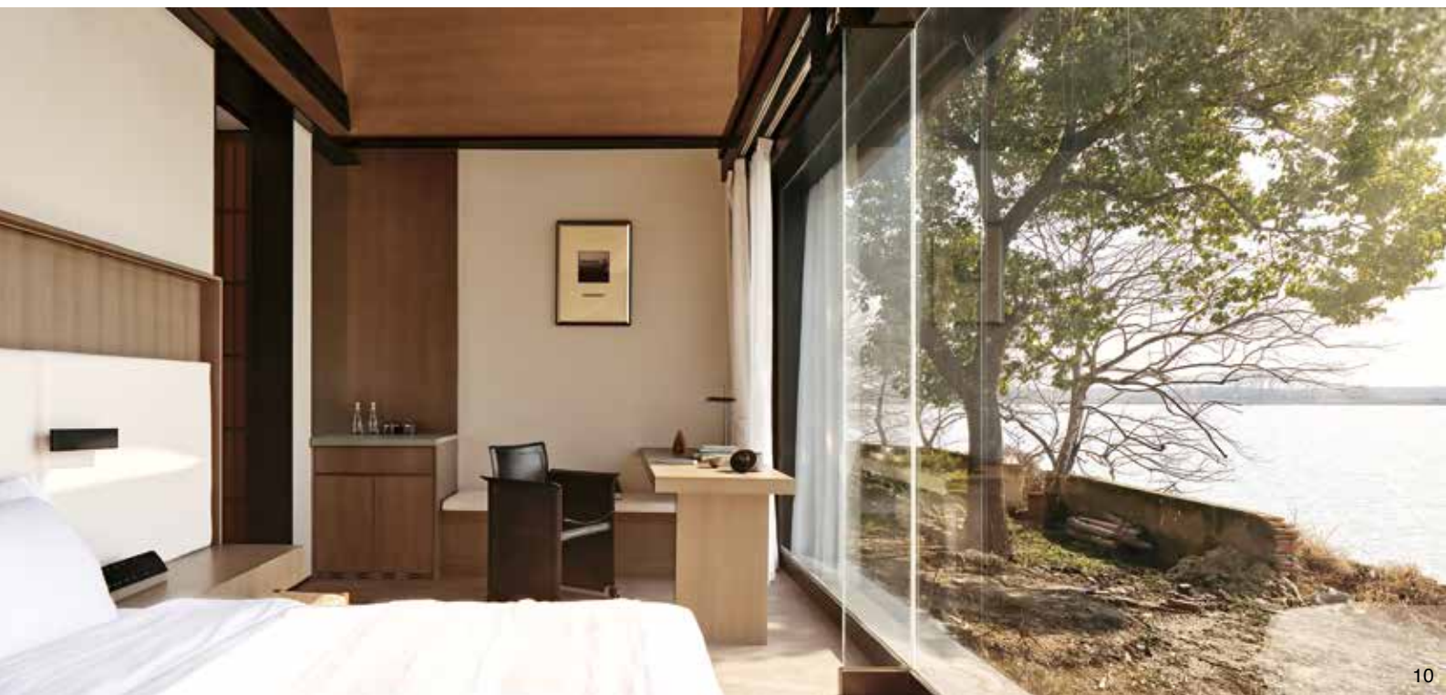
9. 大量採用原木材質，藉真實淳樸的質地予人舒適度與歸屬感。10. 客房重視景觀面，強調與自然環境的緊密關係。11. 弧形屋頂加深了空間的包覆感，就像身處船場之中。12. 客房內劃出多進式動線，為場域轉換加入了想像與期待。13. 客房湯池設置在角落一隅，是最隱密的私享空間。